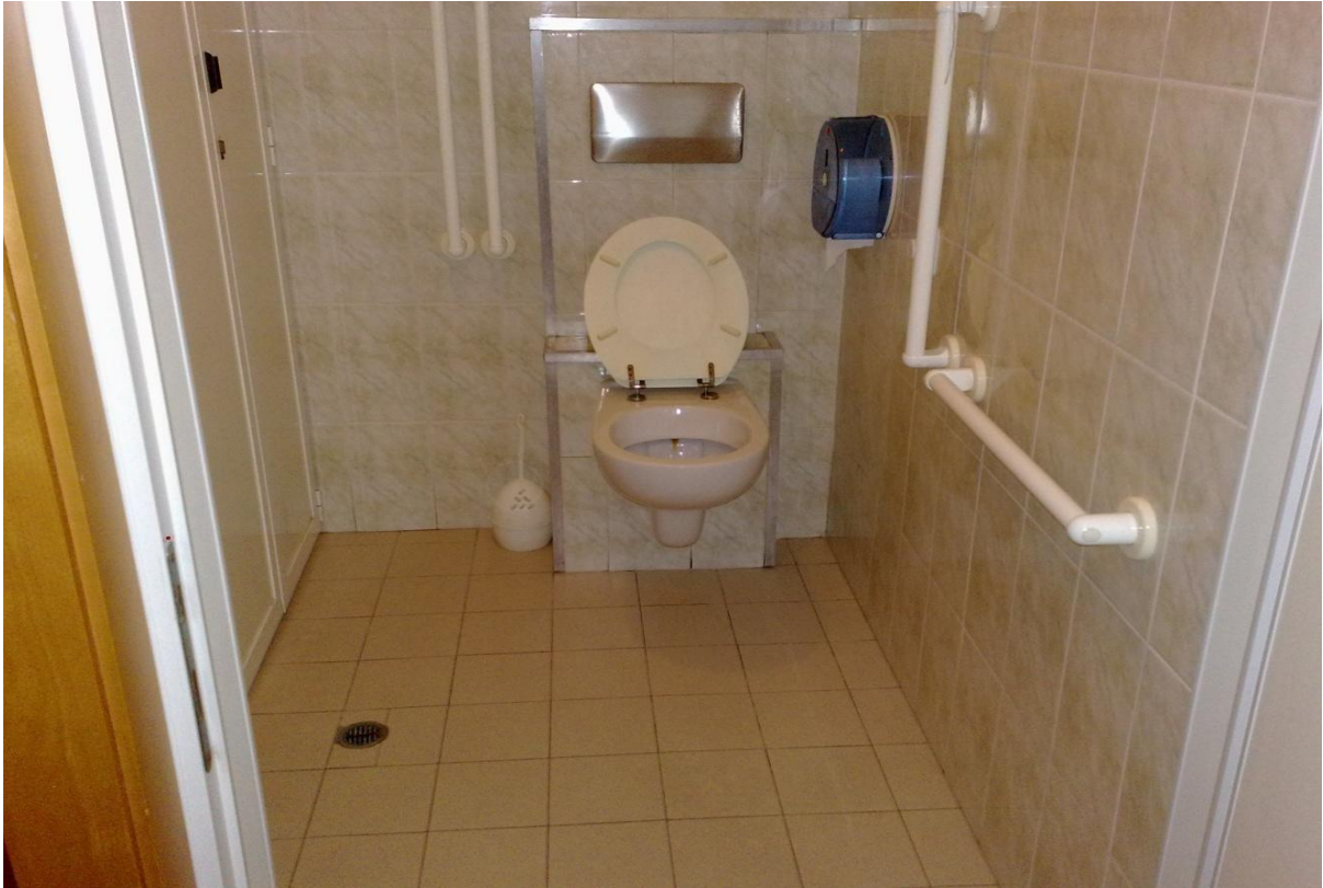
FOTO E PIANTINA DEL BAGNO